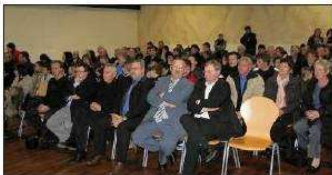
Parmi l'assistance nombreuse, le monde sportif extérieur à la commune était bien représenté.

Après avoir salué les performances de tous les sportifs longlavillois sans exception, M. Bitoun a confirmé la volonté municipale de continuer à aider le tissu associatif, malgré la mise à mal des collectivités qui voient leurs dotations diminuer de façon alarmante. « Ce soir, nous rendons hommage aux sportifs méritants, choisis et retenus par l'OMS et leurs clubs respectifs, mais aussi à l'ensemble des bénévoles. Depuis toujours, notre commune a tenu à rendre hommage au monde associatif et remercie toutes celles et ceux qui s'investissent sans compter au service des autres et en cette