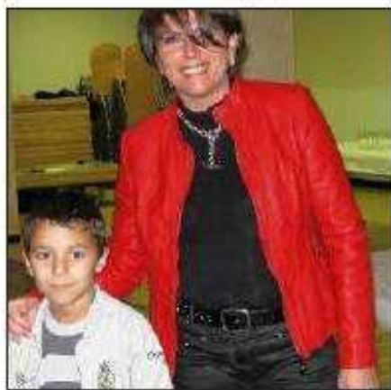
Les plus jeunes ont également été récompensés.